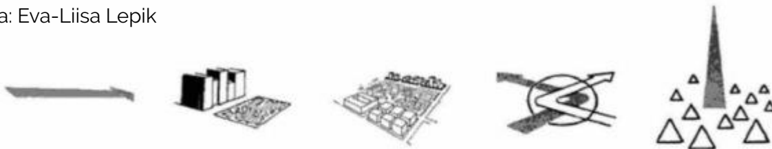
Illustratsioonid: Kevin Lynch, The image of the city, 1960.

Ülesande koostaja: Katrin Koov Slaidide koostaja: Eva-Liisa Lepik